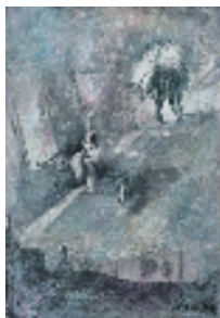
„Flugfeld für Träume“